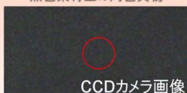
黒色素材上の同色異物

300mm幅において 10\mu\text{m} の欠陥が検出可能な、高速・広視野な欠陥検査装置です。